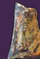
Bois de cervidé